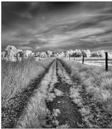
"mi único equipaje" NURIELI

Impresiona ver cómo, tras la Resurrección, Cristo busca a los apóstoles en su labor de pueblo de pescadores y su gesto es sentarse con ellos y asar unos pescados para compartirlos sentados en la playa. Desde ahí les enviará al confín del mundo.