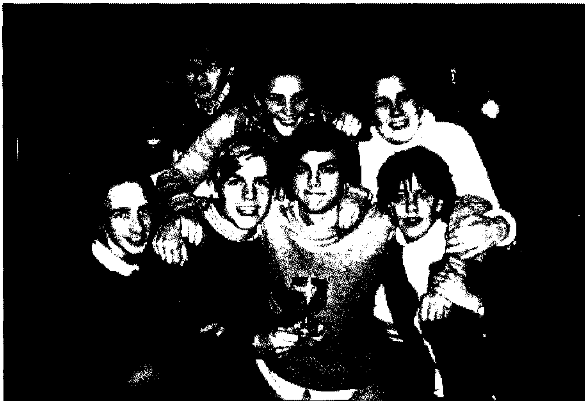
Les huéspedes de una Casa CVX